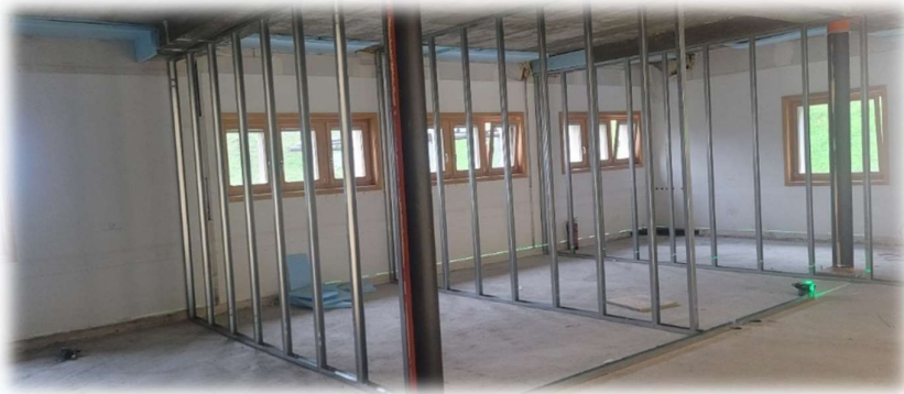
Erste aufgerichtete Wände

Für Arztpraxen gelten hohe Anforderungen an den Schallschutz, um die nötige Diskretion zu gewährleisten. Die Sprech- und Behandlungsräume müssen einen Schallschutz von 50 dB aufweisen, während in den übrigen Zimmern 40 dB gefordert werden. Um Leckagen im Schallschutz, etwa durch Kabelkanäle oder ungünstig platzierte Steckdosen, zu vermeiden, sind sorgfältige Planungen erforderlich. Die neu eingebauten Gips-Innenwände mit doppelter Beplankung erfüllen diese Anforderungen und sind zudem kostengünstig.