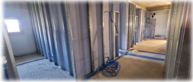
Beplankung und Verlegen von Leitungen vor Installation der neuen Bodenheizung

Die Temperatur und das Raumklima müssen in jedem Raum individuell einstellbar sein. Die Sprech- und Behandlungszimmer an den Aussenwänden benötigen eine angemessene Beheizung, während die im Zentrum des Gebäudes gelegenen Lagerräume und die Apotheke bestimmte Temperaturgrenzen nicht über- oder unterschreiten dürfen. Bisher wurde die Temperatur der gesamten Fläche über eine einzige, durchgehende Bodenheizung geregelt. Diese muss entfernt und durch separate Heizschlaufen für die einzelnen Räumlichkeiten ersetzt werden. Wartezimmer, WCs und Nasszellen erfordern eine ausreichende Belüftung, für deren Zu- und Abluft Aussparungen an der Nordwestfassade angebracht wurden.